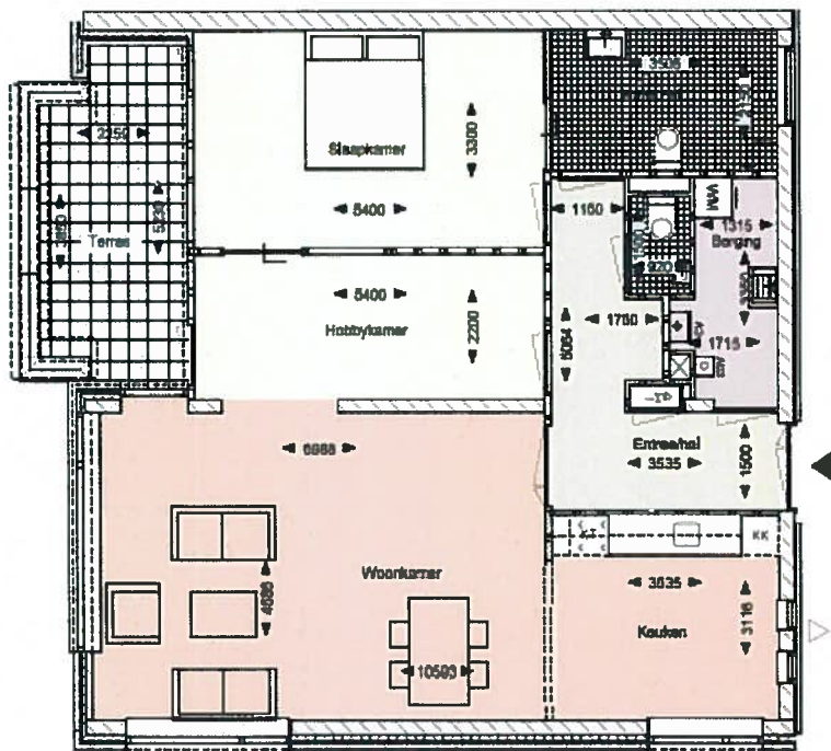
Appartement 3.1 (begane grond)